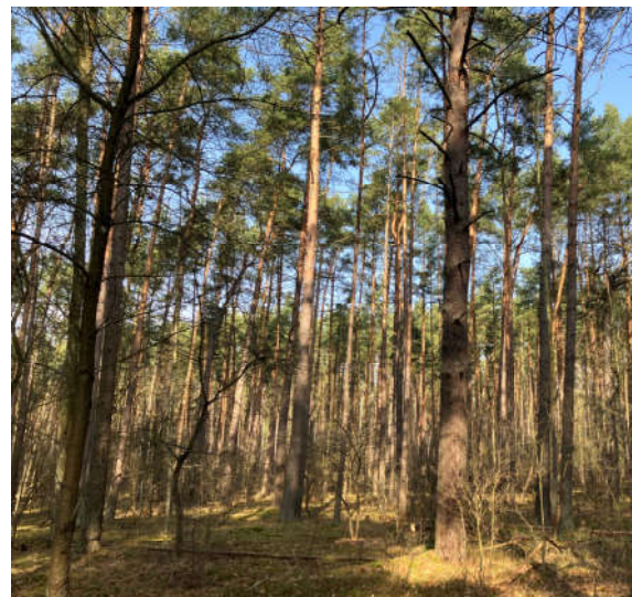
Beispiel für den Waldkieferbestand